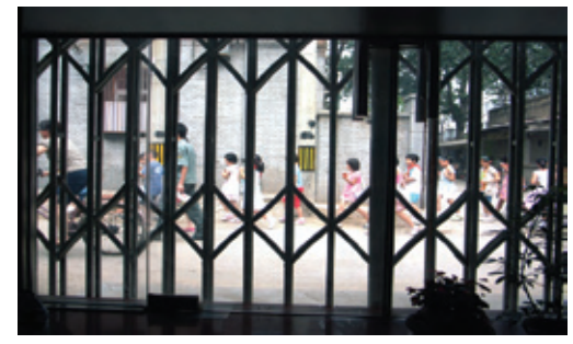
请奥运志愿者阿姨们喝自制的酸梅汤[Homemade suanmeitang is shared with the ais on Olympic duty.]