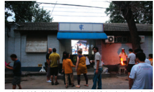
向“失败者”致意的派对将“我们其余的人”凝聚在一起。Wii电子游戏百米赛成绩最靠后的两名选手可获得两张奥运比赛门票[A party held in honor of the 'losers' brings together 'all the rest of us'. The most average scoring runner of the Wii 100 meter dash wins two Olympic event tickets.]